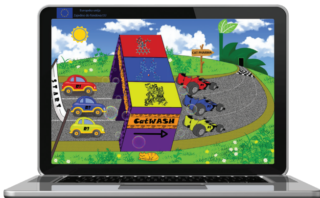
Slika 2 – Karikirani prikaz rada na projektu. Tri automobila, crveni (organokataliza), plavi (kataliza metalnim kompleksima) i žuti (biokataliza) nakon prolaza kroz “CAT wash” od običnih automobila se “transformiraju” u trkaće automobile. Cilj je doći do primjene u gospodarstvu, prikazano kao zelena tvornica.

umskog uparivača (za sigurno uklanjanje otapala u blagim uvjetima) te Vortex miješalice za pripremu uzoraka za kromatografska i druga ispitivanja.