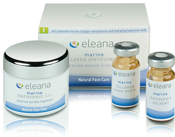
Slika 3 – Kozmetička linija Elana na bazi bioaktivnih spojeva iz morskih spužava

Daljnijim radom na projektima BIOCAPITAL (FP6-MOBILITY) i BIOMINTEC (FP7-PEOPLE) uspostavljena je multidisciplinarna mreža biologa, kemičara i IT stručnjaka s ciljem sustavne potrage za korisnim bioaktivnim spojevima iz morskih beskralješnjaka, protuobraštajnih, antibakterijskih, antiviralnih, citostatičkih te biomineralizacijskih svojstava. Najznačajniji rezultati postignuti su u području enzimatskih procesa depozicije biogenog silicija, te primjene silikateina s drugim materijalima poput titana i cirkonija. Konstruirana je i baza podataka za sve proteine uključene u proces biomineralizacije kalcijeva karbonata u metazoa. Zahvaljujući katalitičkoj aktivnosti silikateina, po prvi put su pri blagim fiziološkim uvjetima sintetizirani organometalni nanokompoziti različitih metalnih oksida sa slojevitom, tzv. Core-Shell strukturom sličnom staklastim spikulama spužava (slika 4). Time su se otvorili horizonti k mnoštvu primjena u medicini, poput zamjene ili regeneracije koštanog, hrskavičnog ili vezivnog tkiva.