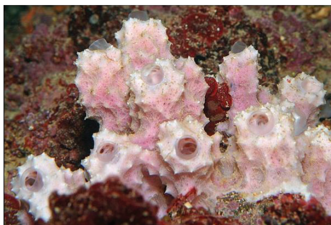
Slika 1 – Spužva Dysidea avara (Schmidt 1862.), živi u Sredozemnom moru

održive proizvodnje dvije bioaktivne komponente: avarola (izoliranog iz spužve Dysidea Avara , slika 1) i silikateina (izoliranog iz spužve Suberites domuncula , slika 2), u dovoljnoj mjeri za pred­tržišna istraživanja.