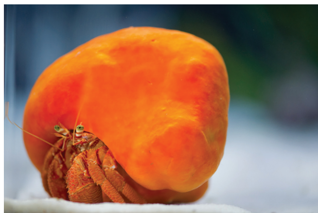
Slika 2 – Spužva Suberites domuncula (Olivi 1792.), obično obrasta puževu kućicu u kojoj je nastanjen rak samac, s kojim živi u simbiozi

Pomoću rezultata projekta SPONGES razvijena je linija kozmetičkih proizvoda (slika 3) na bazi bioaktivnih spojeva iz morskih spužava, a do predtržišne faze doveden je i novi kozmetički proizvod, Eleana – krema na bazi avarola , pogodna za iziritiranu kožu, s umirujućim i protuupalnim svojstvima. Projekt je rezultirao i značajnim napretkom u istraživanjima Crambescidin 800 i njegove potencijalne primjene u antitumorskim lijekovima.