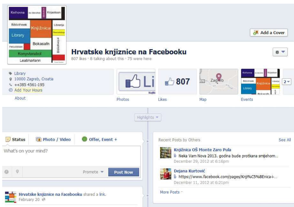
Slika 2. Knjižnice na Facebooku 6. 3. 2013.

Za potrebe istraživanja o hrvatskim knjižnicama na Facebooku, knjižnica Instituta Ruđer Bošković je 16. studenog 2009. g. pokrenula za javnost otvorenu stranicu Hrvatske knjižnice na Facebooku . 26 S obzirom da je stranica sadržajno usko ograničena i svodi se na prikupljanje poveznica