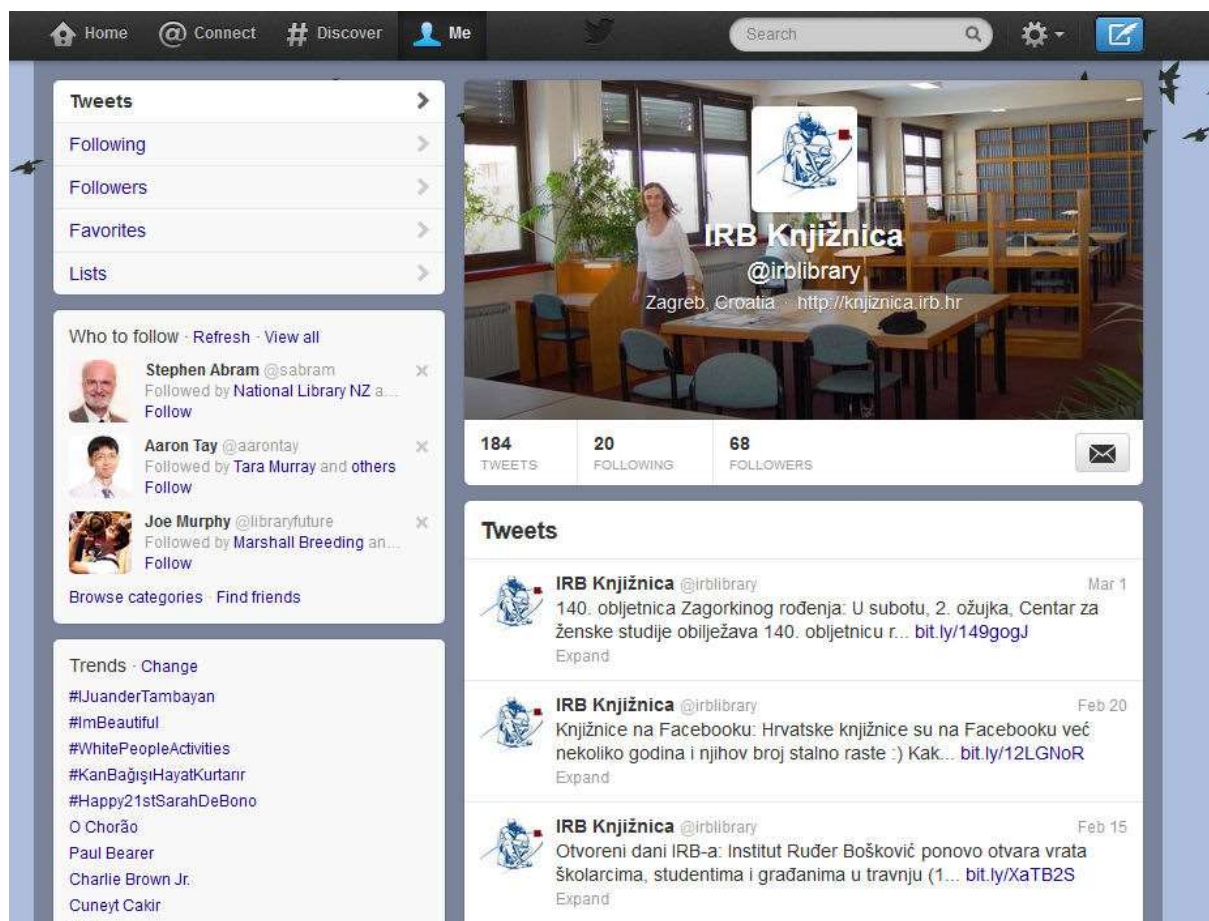
Slika 6. Twitter stranica Knjižnice Instituta Ruđer Bošković 6. 3. 2013.