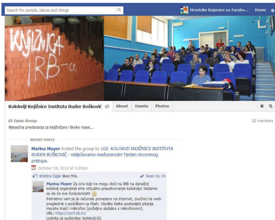
Slika 1. Skupina Kolokviji knjižnice Instituta Ruđer Ruđer Bošković 6. 3. 2013.