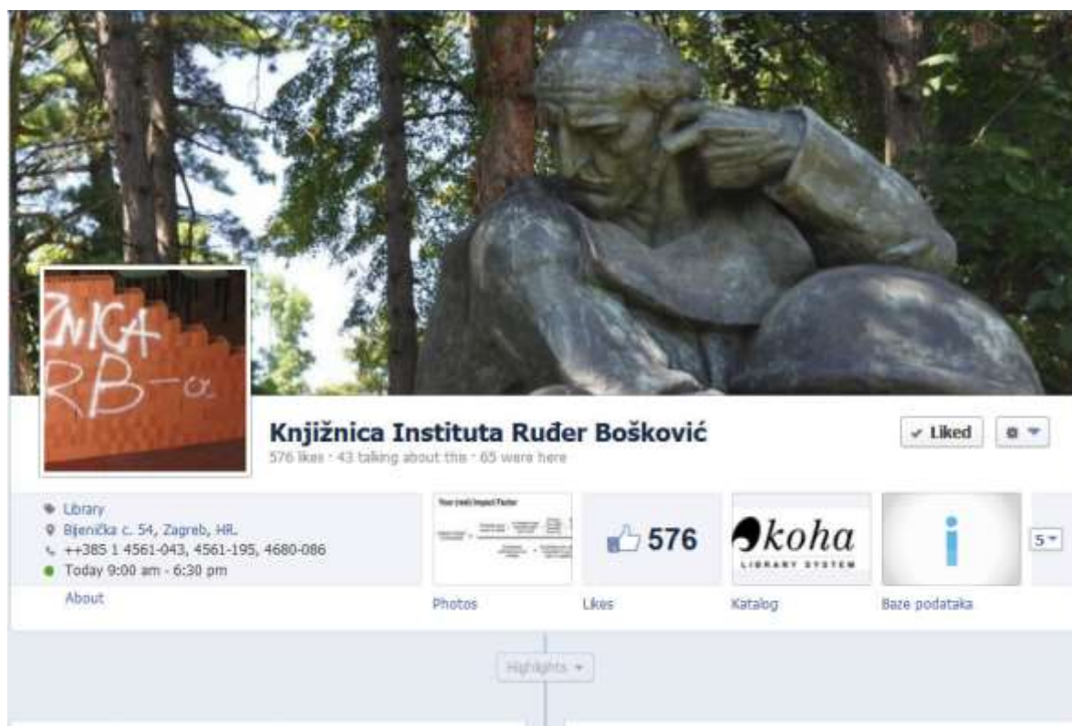
Slika 4. Facebook stranica Knjižnice Instituta Ruđer Bošković 6. 3. 2013.

Naposljetku je knjižnica Instituta Ruđer Bošković 3. prosinca 2009. g. pokrenula vlastitu knjižničnu stranicu. Glavni poticaj bila je želja za promidžbom knjižnice, odnosno povećanjem njezine vidljivosti širem krugu potencijalnih korisnika, osobito virtualnih.