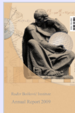
Annual Report (en)