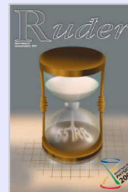
Ruđer: znanstveno glasilo IRB-a