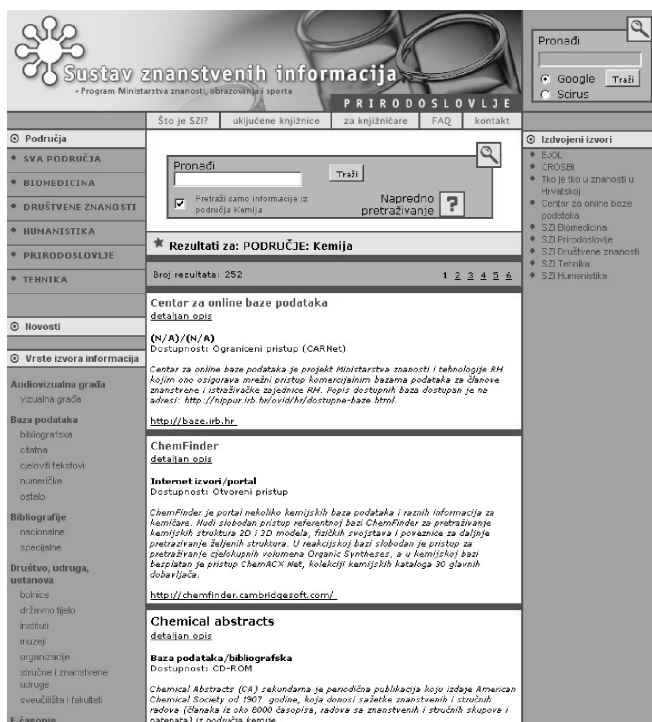
Slika 3 – Prikaz dijela informacijskih izvora iz područja kemije

cijski izvor postoji skraćeni opis s poveznicom na internet, a na raspolaganju je i detaljan zapis sa cjelovitim opisom informacijskog izvora unutar baze podataka.