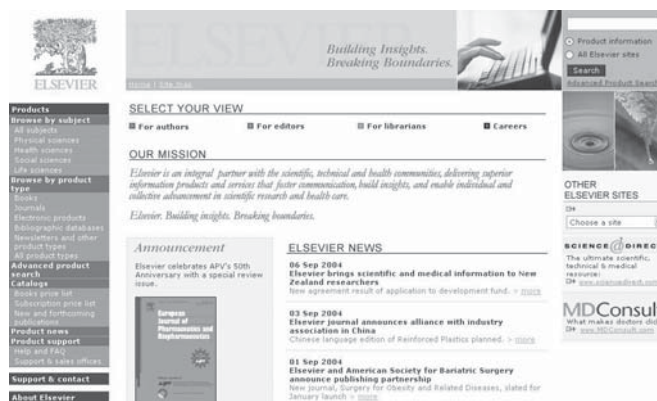
Slika 1 — Početna stranica izdavačke kuće Elsevier

cnim ugovorima uvjetovao ustanovama nemogućnost otkazivanja tiskanih pretplata na pojedine naslove tijekom višegodišnjih razdoblja, opravdavajući to "povoljnim uvjetima ugovora". Tako su sveučilišta uz nadoplatu od desetak posto kupovala pristup paketima elektroničkih inačica časopisa, što je uz redovno godišnje poskupljenje cijene časopisa znatno povećalo ulaganja u časopisni fond. Razdvajanjem pretplate na tiskanu i elektroničku postupak pretplate postao je složen, a paketi časopisa koji se nude po naizgled "povoljnim" uvjetima guraju ustanove u sve veća ulaganja koja često nisu u korelaciji s korištenjem časopisa. Elsevier tako uspješno povećava svoj profit posljednjih godina za 40% godišnje. Dobavljačima preko kojih knjižnice kupuju časopise postalo je također sve teže snalaziti se u mnoštvu novih mogućnosti, licencnih uvjeta i pravila te braniti interese korisnika.